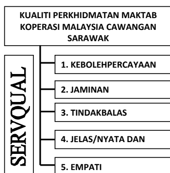
Rajah 2 : Kerangka konseptual kajian

Tujuan kajian ini adalah untuk mengkaji tahap dan faktor daripada dimensi SERVQUAL yang menyumbang kepada persepsi kualiti perkhidmatan berbanding tahap kualiti perkhidmatan yang diperolehi oleh peserta yang menghadiri kursus jangka pendek dan latihan MKMCS. Kerangka konseptual bagi kajian ini adalah seperti dalam Raiah 2.